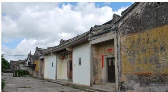
澄海前美村儒林第、大夫第（南向）