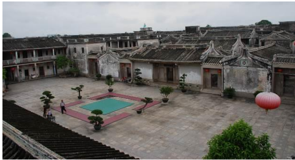
澄海前美村善居室俯瞰

就民居形态的演化而言，一方面，在侨居地建筑文化影响下，近代广东三大民系的侨乡民居在材料技术、建筑符号、空间形态及装饰语言等方面发生变化并表现出与侨居地建筑文化的趋同性；另一方面，中外文化交流的程度不同导致近代广东侨乡民居形态差异演化，从而表现为广府侨乡的“合流式”，潮汕侨乡的“吸纳式”，客家侨乡的“嵌入式”。就民居审美特征而言，在近代广东侨乡的民系文化精神影响下，广府侨乡民居体现开放兼容精神，表现出世俗化、商品化和个性化的特征；潮汕侨乡民居表现出尊儒崇礼与重商炫富、宏大叙事与精益求精并存的双重性格，客家侨乡民居凸显慎终追远、耕读传家和礼乐相济精神。